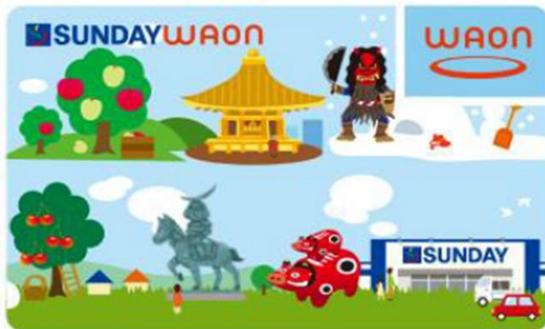
サンデーが営業する東北6県の名所や特産物、伝統行事で「あなたの街のサンデー」をイメージしたデザインです。