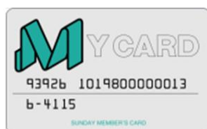
サンデーマイカード (現金ポイントカード)